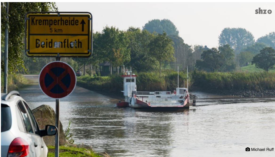
Die Störfähre Else ist die Verbindung zwischen der Wilster- und Krempmarch.

Eine neue Internetseite soll für einen Netzwerk-Effekt sorgen. Die Fähre kann sich nicht aus Mitgliedsbeiträgen tragen.